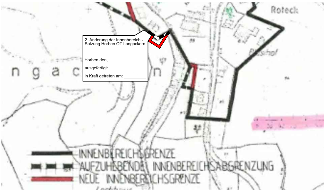
Deckblatt M. 1:3000 zum einpflegen in Originalplan